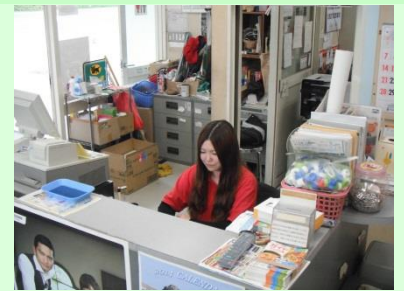
▲販売システムへの入力

私は当初、専門学校に進学予定でしたが、東日本大震災の影響で急きょ就職する事になりました。その中で、採用になったのが現在の会社です。私が働いている職場の皆さんは、とてもフレンドリーで毎日楽しく働いています。私は中学からソフトボールをやっていて、今でも社会人のチームに入っていて続けますが、仕事が終わってからも練習などに参加して、体を動かしています。休日は大会に出たり、友達と遊びに行ったりと、毎日充実した日々を過ごしています。