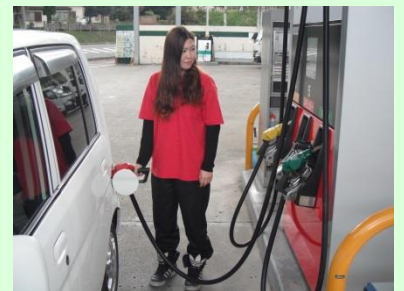
▲給油をしているところ