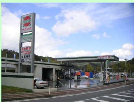
▲給油所（ガタゴンサービスステーション）外観

1ヶ月単位の変形労働時間制 シフト制により、1週間の勤務時間が40時間を超える場合など、週ごとの勤務時間が異なる場合、1ヶ月を平均し、週40時間以内の労働時間とすること