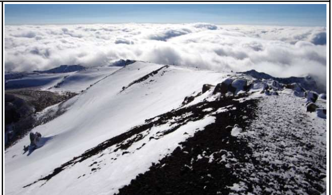
お鉢(山頂付近)から南方の景観