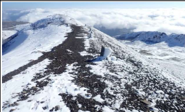
お鉢上から東方の景観

平日だったこともあり、登山者は少なく登山口～山頂間で出会ったのは4名のみで、馬返し以外の他コースから来ていた足跡もありませんでした。岩手山の東～北側は青空で、展望もよかった一方、西～南側は雲に被われていましたが、不動平～お鉢間では、時々雲がはれて雲海を背景に迫力ある雪景を楽しめました。