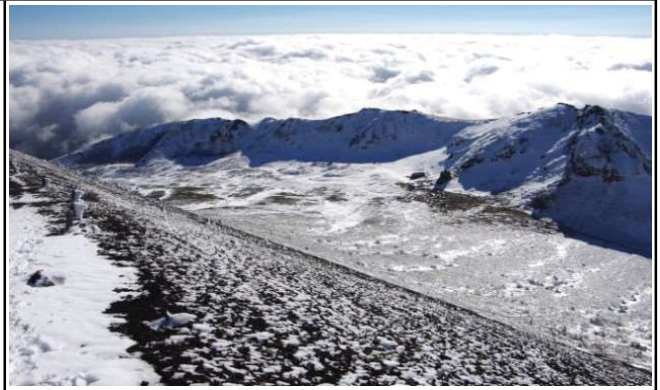
お鉢から不動平俯瞰

平日だったこともあり、登山者は少なく登山口～山頂間で出会ったのは4名のみで、馬返し以外の他コースから来ていた足跡もありませんでした。岩手山の東～北側は青空で、展望もよかった一方、西～南側は雲に被われていましたが、不動平～お鉢間では、時々雲がはれて雲海を背景に迫力ある雪景を楽しめました。