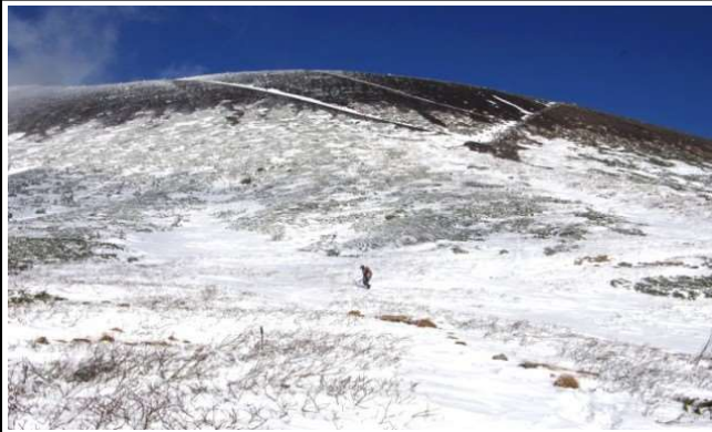
9合目不動平からお鉢斜面

先週末の降雪で岩手山はかなり白くなりましたが、好天の22日に馬返しコースを往復して岩手山の初冬の雪景色を見ることが出来ました。積雪は1合目で約10cm、6合目付近から上部は平均30cm、吹き溜まり箇所では50cm以上でしたが、前日及び当日のトレース跡があったので、なんとか山頂まで到達出来ました。気温が高かったので、雪はやわらかくアイゼン等の滑り止めなしで歩きましたが、時々圧雪を踏み抜くことがあり、午後下山時は苦労しました。7合目から上部は、風速10m以上の強風だったものの風は冷たくなかったので歩行可能でした。