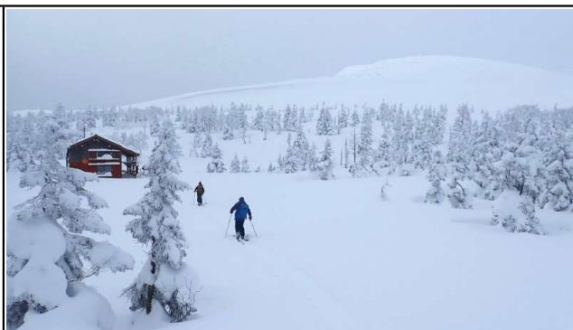
三ツ石小屋と三ツ石山東斜面

今冬は暖冬、少雪となっていますが、前日までの4日間厳寒の冬型天気が続き、やや少なかった網張スキー場の積雪も180cmに増えました。28日(日)は曇天でしたが、風は無く視界も悪くなかったので、網張スキー場から大松倉山経由で三ツ石山に行ってきました。三ツ石山は県境の主脈から東側に少し離れているので立派な樹氷は形成されませんが、降雪直後の雪景色と稜線部の強風が作るシュカブラ(風紋)に期待して登りました。しかし、今年は風の強い日が少ないようで、シュカブラはほとんど出来ていませんでした。樹氷の方は、直前の降雪で枝葉は雪に被われ、痩せてはいるものの予想よりも綺麗な樹氷となっていました。三ツ石山到着後に少し待っていたところ、雲の切れ間から時々日が射し、光に輝く雪原風景も見ることができました。