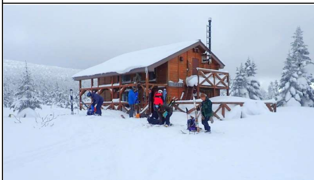
三ツ石小屋(積雪はほぼ例年なみ)

今冬は暖冬、少雪となっていますが、前日までの4日間厳寒の冬型天気が続き、やや少なかった網張スキー場の積雪も180cmに増えました。28日(日)は曇天でしたが、風は無く視界も悪くなかったので、網張スキー場から大松倉山経由で三ツ石山に行ってきました。三ツ石山は県境の主脈から東側に少し離れているので立派な樹氷は形成されませんが、降雪直後の雪景色と稜線部の強風が作るシュカブラ(風紋)に期待して登りました。しかし、今年は風の強い日が少ないようで、シュカブラはほとんど出来ていませんでした。樹氷の方は、直前の降雪で枝葉は雪に被われ、痩せてはいるものの予想よりも綺麗な樹氷となっていました。三ツ石山到着後に少し待っていたところ、雲の切れ間から時々日が射し、光に輝く雪原風景も見ることができました。