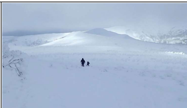
一時光が射した山頂北側の雪原

日曜日だったので、我々3名含め約20名が三ツ石山に向かっていました。スキーでのラッセル深は20~30cmでしたが前日のトレースがあり、ラッセルの苦勞なく歩けました。網張スキー場からのコースには所々テープの目印がついていますが、風などで切れているものも多く、今回少し補充しました。今冬もバックカントリーでの遭難事故が発生していますので、悪天時は無理せず、関係者に迷惑かけないようにしてください。