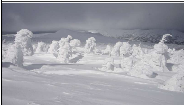
綺麗な樹氷も見られた(山頂北側)

日曜日だったので、我々3名含め約20名が三ツ石山に向かっていました。スキーでのラッセル深は20~30cmでしたが前日のトレースがあり、ラッセルの苦勞なく歩けました。網張スキー場からのコースには所々テープの目印がついていますが、風などで切れているものも多く、今回少し補充しました。今冬もバックカントリーでの遭難事故が発生していますので、悪天時は無理せず、関係者に迷惑かけないようにしてください。