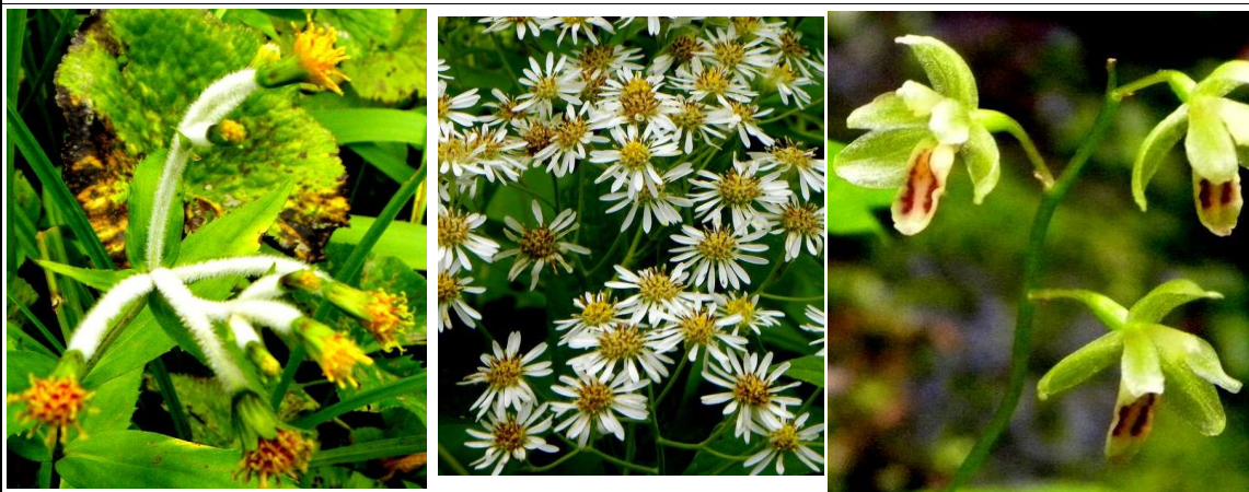
(左から) チョウジギク、ゴマナ、コイチョウラン

「山の日」でしたが、一般登山者は1名ほど。拍子抜けしてしまいました。沢山の登山者が山の日なのでお出でになるかと期待していましたが…。中沼登山口より同行者2名と入山しました。登山道沿いには初秋の花が見られました。ソバナ、マルバキンレイカが咲き始めていました。中沼には先日大きなイワナと思われる魚を捕食していた「アオサギ」(?)が今日もエサを探していたようでした。