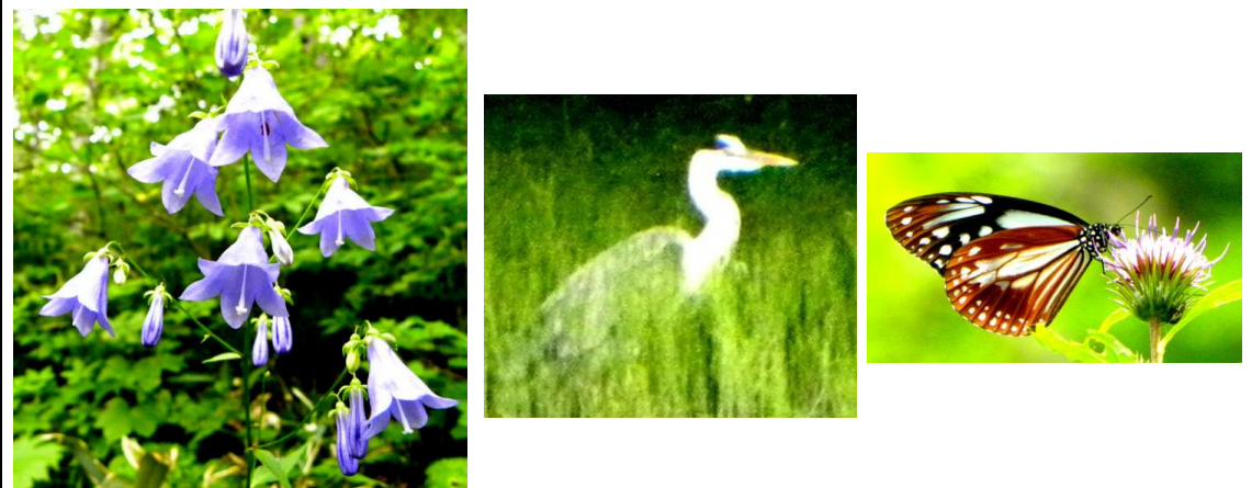
(左から) ソバナ、アオサギ(?)、アサギマダラ

「山の日」でしたが、一般登山者は1名ほど。拍子抜けしてしまいました。沢山の登山者が山の日なのでお出でになるかと期待していましたが…。中沼登山口より同行者2名と入山しました。登山道沿いには初秋の花が見られました。ソバナ、マルバキンレイカが咲き始めていました。中沼には先日大きなイワナと思われる魚を捕食していた「アオサギ」(?)が今日もエサを探していたようでした。