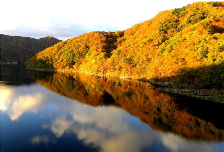
胆沢ダム湖に映える紅葉