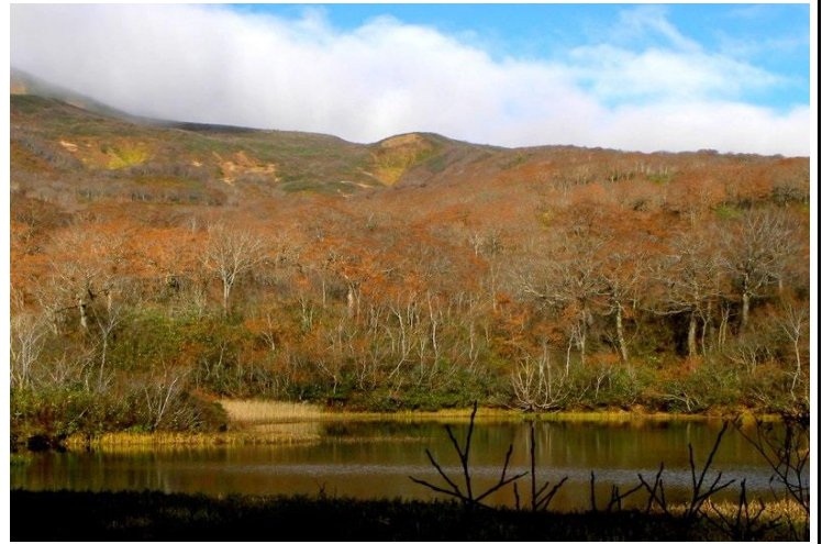
紅葉の終わった上沼

7時に中沼登山口より入山しました。紅葉は中沼駐車場の 上の方が見頃です。胆沢ダムや焼石の山麓は今が紅葉 の見頃を迎えています。