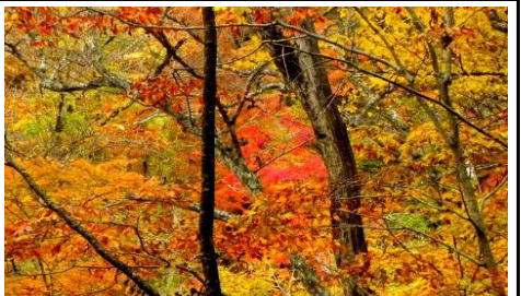
(左から) マンネンズギ、コケの胞子嚢、ヒカゲノカズラ、尿前溪谷付近の紅葉