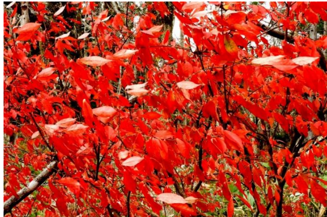
風に吹かれる紅葉のニシキギ