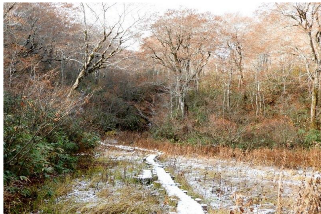
雪で白くなった木道

次は14日に石淵トンネル前のゲートが閉鎖になるそうです。国道397号線は通行できなくなりますので、つぶ沼登山口からの入山はできません。積雪前は中沼林道に入れますので、中沼登山口からの入山は可能です。