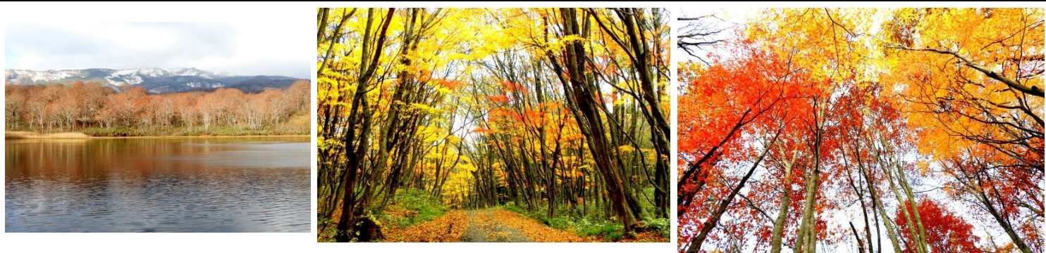
【写真左：中沼より横岳を望む 中・右：山麓の紅葉】

焼石連峰の紅葉はほとんど終わりましたが、山麓の紅葉は今が盛りです。胆沢ダムから国道397号線沿いがとてもきれいですが、7日正午に平七橋のゲートが閉鎖される予定です。