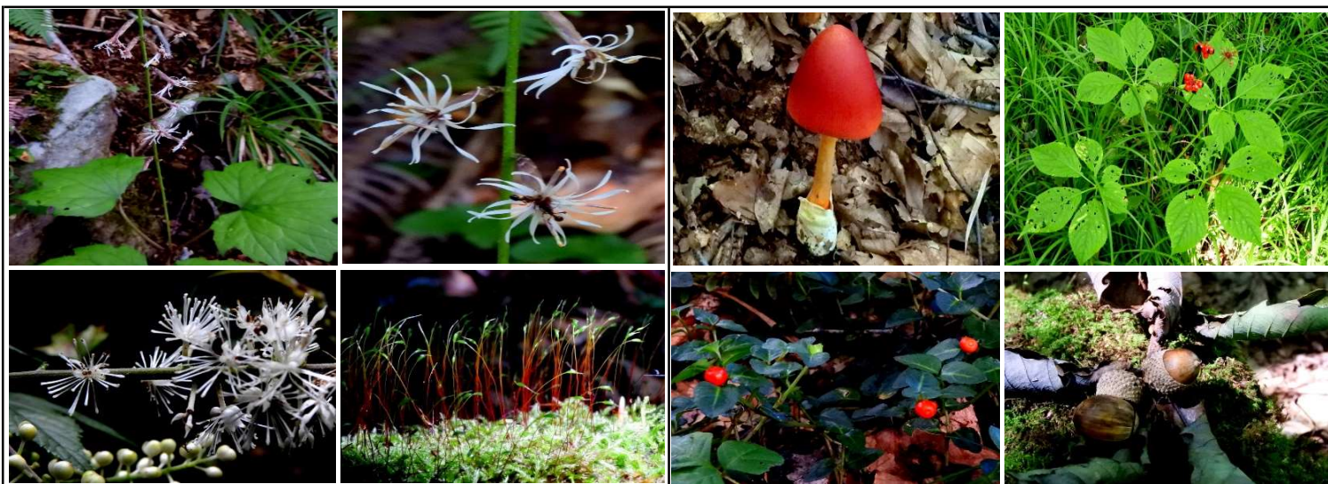
上段：オクモミジハグマ