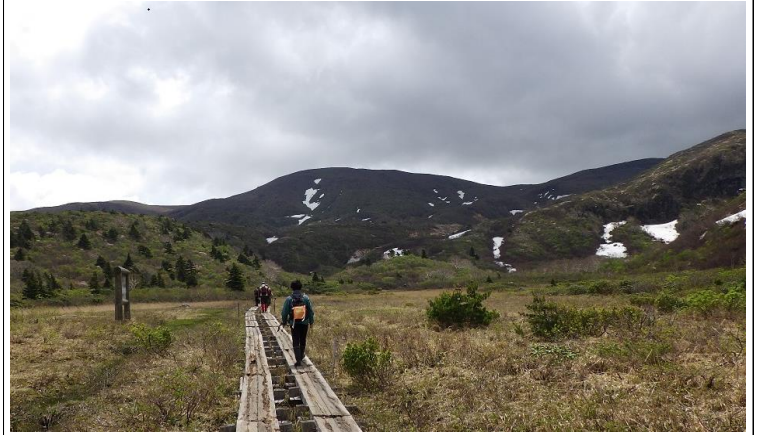
名残ヶ原の木道を行く