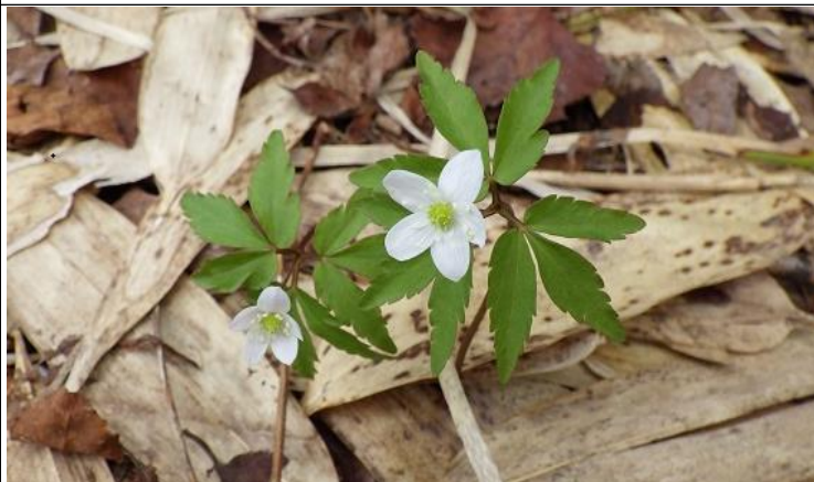
多く見られたヒメイチゲ