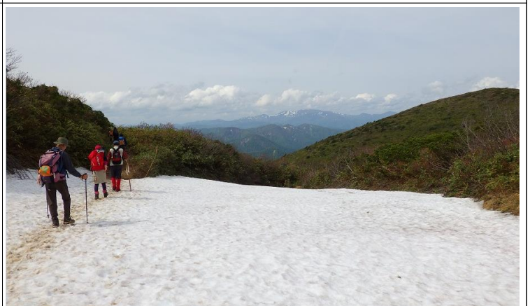
大雪渓を踏みしめて

例年5月第3日曜は栗駒山の山開き行事です。岩手県側の栗駒国定公園では、主催者が変わったそうですが須川高原の須川ビジターセンター前で関係者の出席のもと安全祈願が執り行われました。