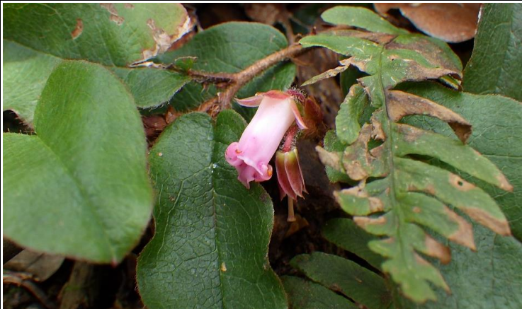
登山道沿いに咲くイワナン