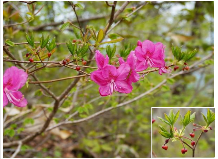
ムラサキヤシオとコヨウラクツツジ

この日は一本杉口から登り、コワ坂口に下山。いずれも安全対策等のため固定ロープや梯子などが設置され一般登山者の安全確保に大きな効果を発揮しています。地元山岳関係者の努力に感謝と敬意を表します。