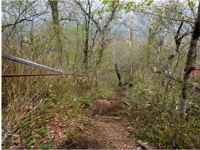
コワ坂コース山頂直下の固定ロープ

この日は一本杉口から登り、コワ坂口に下山。いずれも安全対策等のため固定ロープや梯子などが設置され一般登山者の安全確保に大きな効果を発揮しています。地元山岳関係者の努力に感謝と敬意を表します。