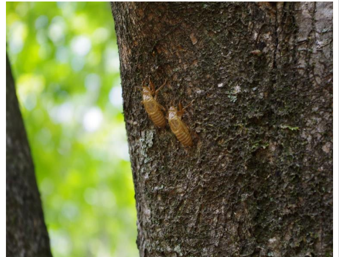
エゾハルゼミの抜け殻

登山道から辺りの木々を見渡すとエゾハルゼミの抜け殻はたくさん見受けられ、脱皮したエゾハルゼミの大合唱が初夏を感じさせてくれます。