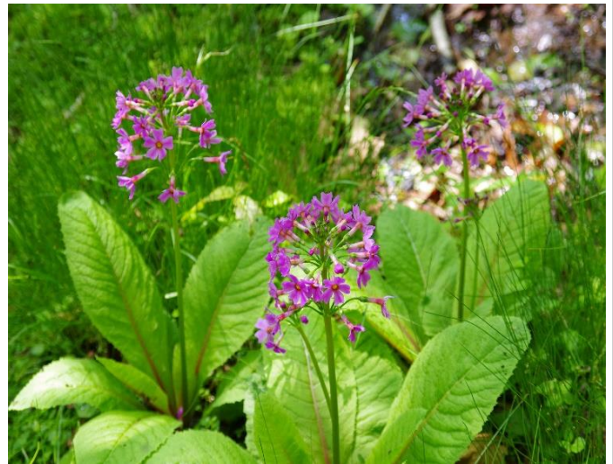
クリンソウが咲き始めました