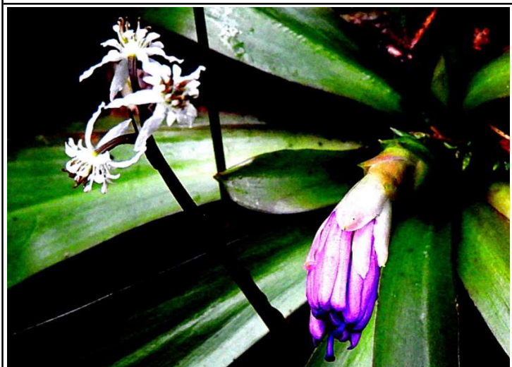
咲きそうなショウジョウバカマとセリバオウレン