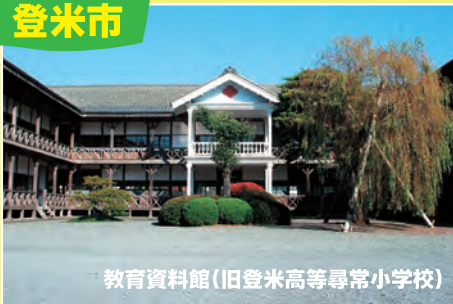
教育資料館(旧登米高等尋常小学校)