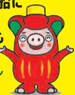
大船渡市 PR キャラクター おおふなトン