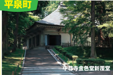
中尊寺金色堂新覆堂