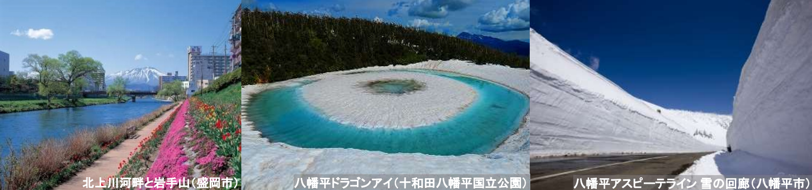
北上川河畔と岩手山(盛岡市)