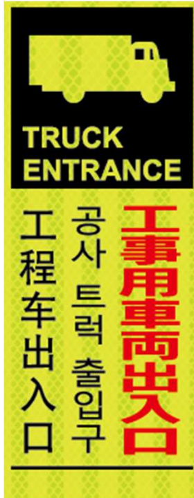
工事用車両出入口 TRUCK ENTRANCE 공사 트럭 출입구 工程车出入口