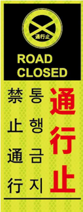
通行止 ROAD CLOSED 통행금지 禁止通行