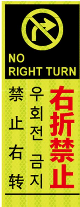
右折禁止 NO RIGHT TURN 우회전 금지 禁止右转