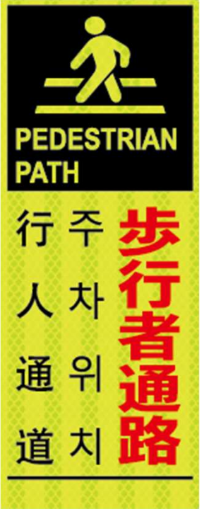
歩行者通路 PEDESTRIAN PATH 주차위치 行人通道