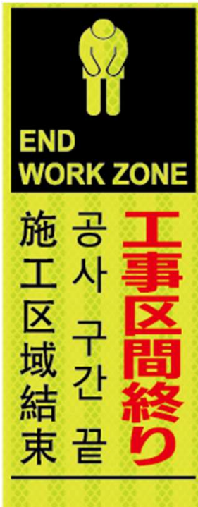
工事区間終り END WORK ZONE 공사 구간 끝 施工区域結束