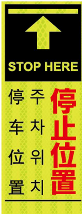
停止位置 STOP HERE 주차위치 停车位置