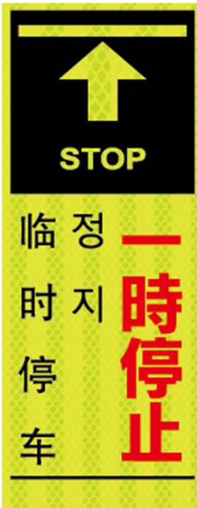
一時停止 STOP 정지 临时停车