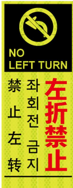
左折禁止 NO LEFT TURN 좌회전 금지 禁止左转