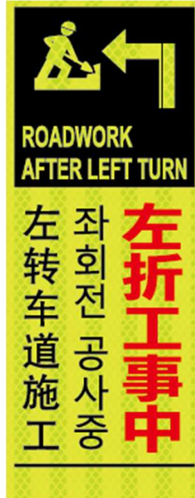
左折工事中 ROADWORK AFTER LEFT TURN 좌회전 공사중 左转弯车道施工