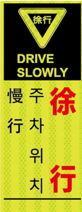
徐行 DRIVE SLOWLY 주차위치 慢行