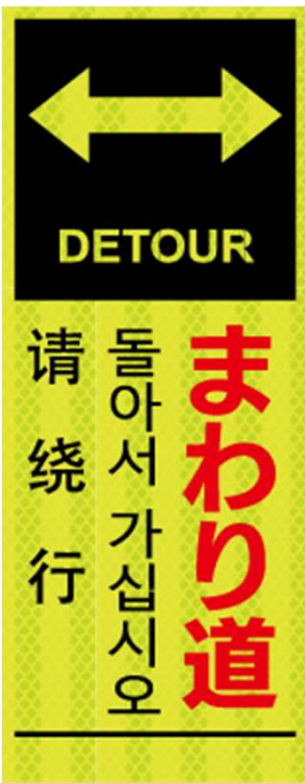
まわり道 DETOUR 돌아서 가십시오 请绕行