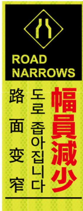
幅員減少 ROAD NARROWS 도로 좁아집니다 路面变窄