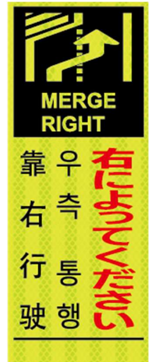
右によってください MERGE RIGHT 우측 통행 靠右行驶