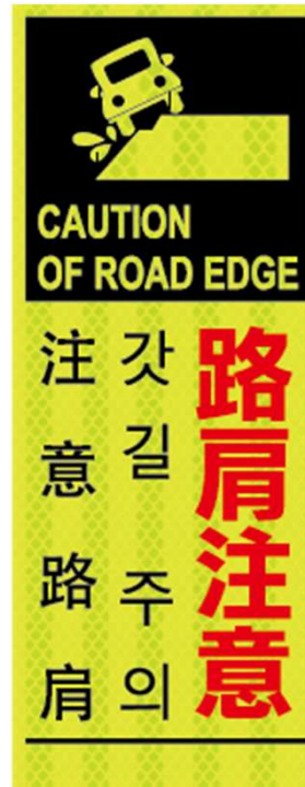
路肩注意 CAUTION OF ROAD EDGE 갓길 주의 注意路肩