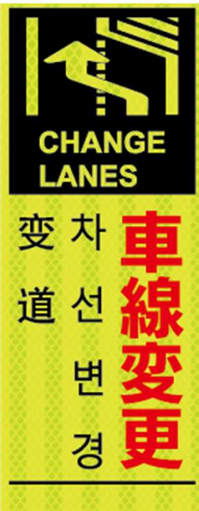
車線変更 CHANGE LANES 차선 변경 变道