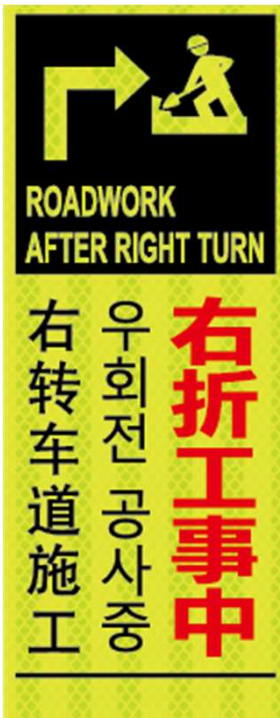
右折工事中 ROADWORK AFTER RIGHT TURN 우회전 공사중 右转弯车道施工