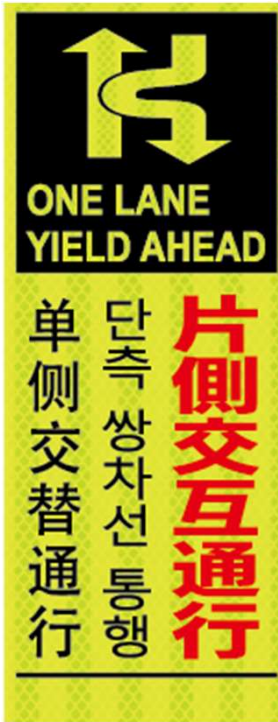
片側交互通行 ONE LANE YIELD AHEAD 단측 쌍차선 통행 单侧交替通行