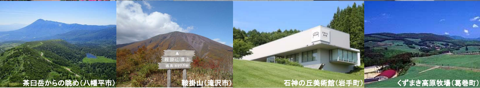
茶臼岳からの眺め(八幡平市)