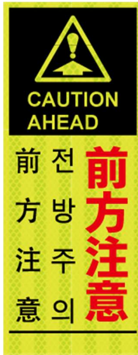
前方注意 CAUTION AHEAD 전방 주의 前方注意