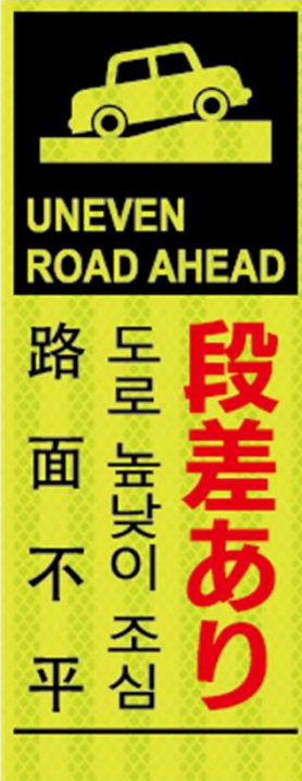
段差あり UNEVEN ROAD AHEAD 도로 높낮이 조심 路面不平