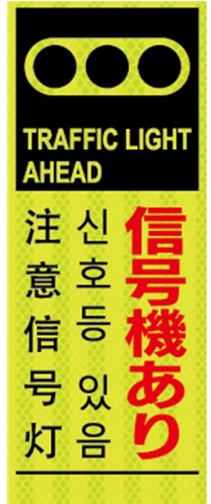
信号機あり TRAFFIC LIGHT AHEAD 신호등 있음 注意信号灯