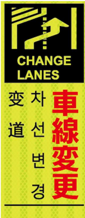
車線変更 CHANGE LANES 차선 변경 变道