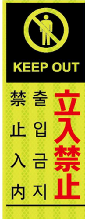
立入禁止 KEEP OUT 출입금지 禁止入内