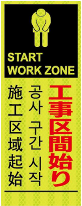
工事区間始り START WORK ZONE 공사 구간 시작 施工区域起始