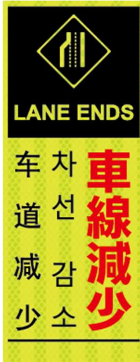
車線減少 LANE ENDS 차선 감소 车道减少