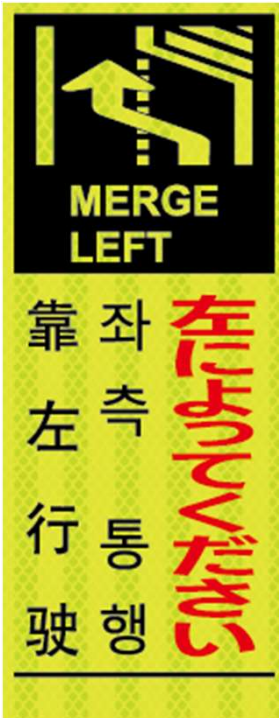
左によってください MERGE LEFT 좌측 통행 靠左行驶