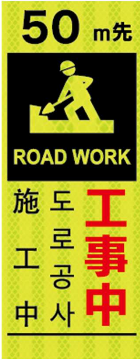
工事中 ROAD WORK 도로공사 施工中