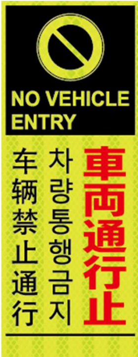
車両禁止通行 NO VEHICLE ENTRY 차량통행금지 车辆禁止通行