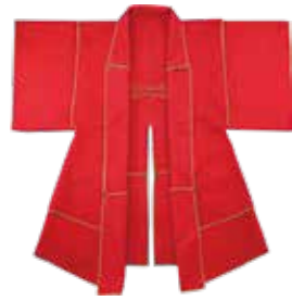
絳羅紗地(白羽)(ひら)しゃじ(か)ば (もり)お(か)歴史文化館蔵

地質・考古・歴史・民俗各分野の資料から、赤色の人々にどのような影響を与え、暮らしの中で生かされてきたかを伝えます。