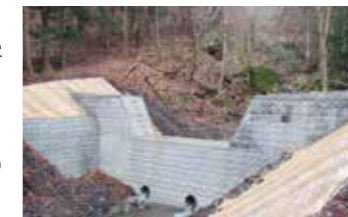
土砂災害を防止する治山の様子

山崩れや土石流、地すべりなどの山地災害から命や財産を守るためには、身近にある危険な場所を知っておくことが大切です。県はホームページで山地災害危険地区の情報を公開していますので、事前に確認して備えておきましょう。山の斜面や川の異常を感じたときは、市町村や最寄りの県広域振興局にご連絡ください。