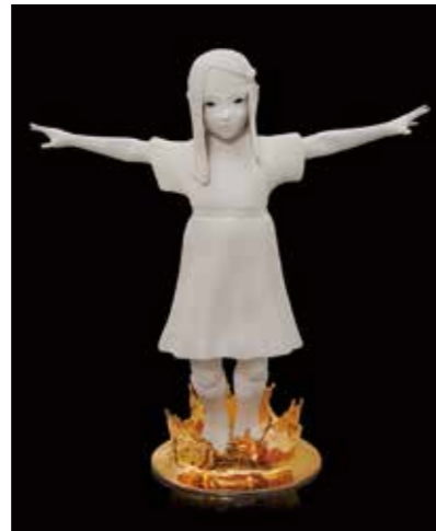
キム・シモンソン《金色の水たまりにジャンプする少女》2012、2020年

世界各地で活躍する奈良美智(ならよしとも)(日本)、バス・カヴェナー(アメリカ)、ステファニー・クエール(イギリス)、スーザン・ホールズ(イギリス)、キム・シモンソン(フィンランド)による「人」と「動物」をテーマにした現代陶芸作品や関連作品約100点を紹介します。