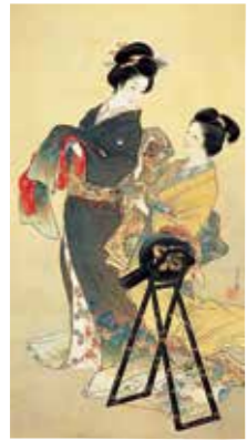
上村松園(つえむらしゅうえん)《美人図》 1907年頃 福富太郎コレクション資料室蔵

戦後、実業家として名を馳せた、福富太郎の所蔵する美術コレクションの中から、美人画、洋画など約80点を展示します。