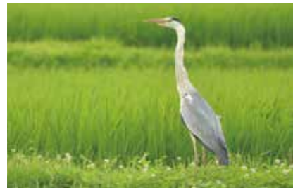
夏の水辺のアオサギ

河川・湿原・水田・湖沼(こしょう)・干潟など水辺に住む生物の多様性や生態、博物館による調査研究を紹介します。