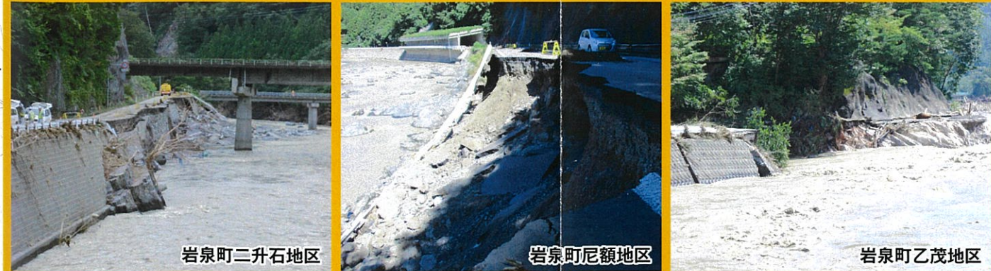
岩泉町二升石地区