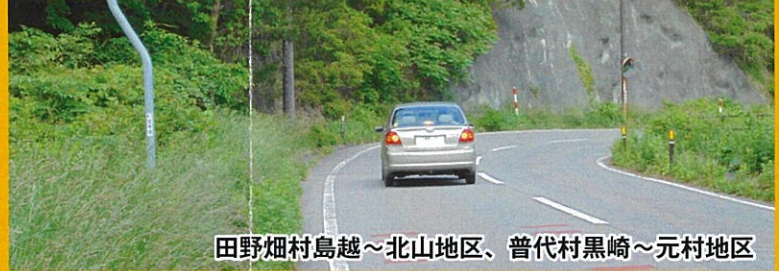
田野畑村島越～北山地区、普代村黒崎～元村地区