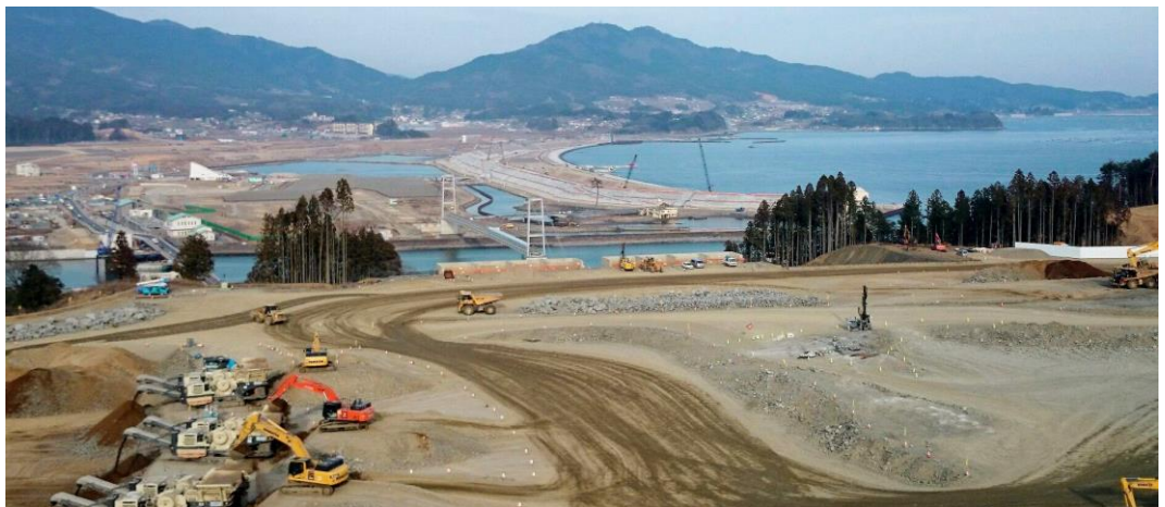
高台における造成工事の様子(2016年頃)

ありがとうございます。都市再生機構の3つの柱の事業、特に震災復興支援事業が改めて認識できました。ここ陸前高田市の復興に都市再生機構の支援があったこと、そして今現在、「まち」としての活性化につながっていることを認識できました。