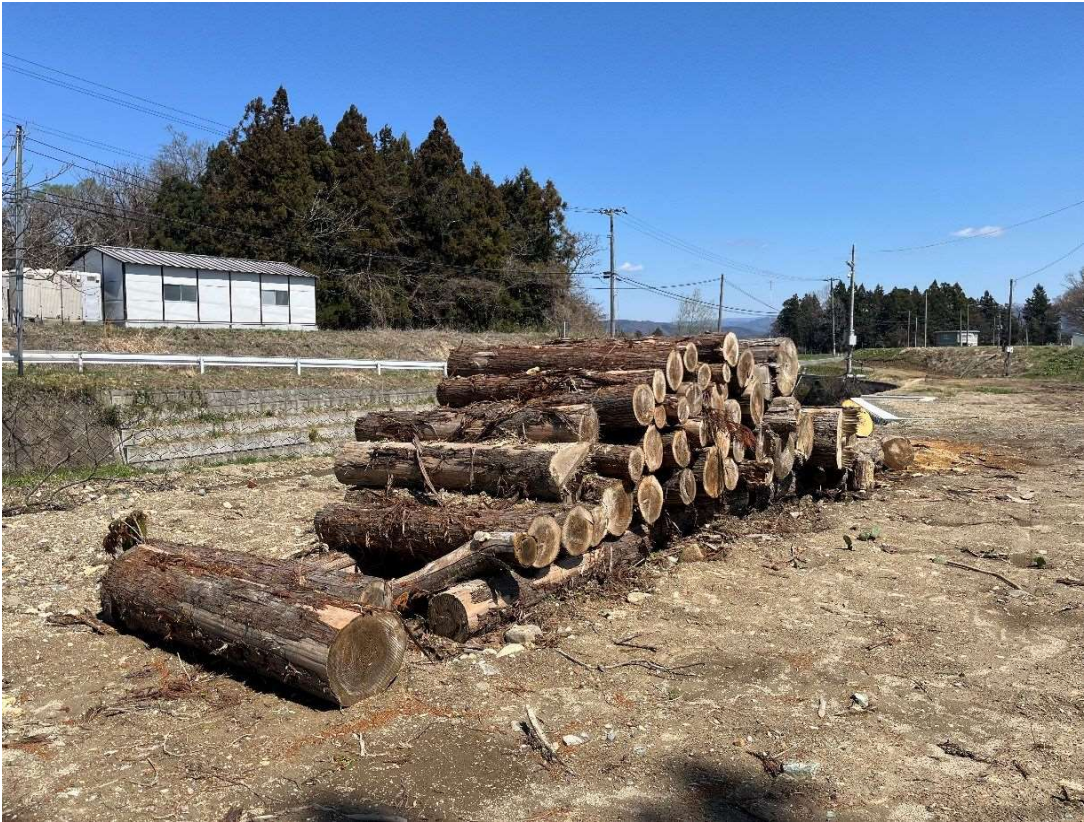
【岩崎川 山王茶屋前橋 右岸 上流】