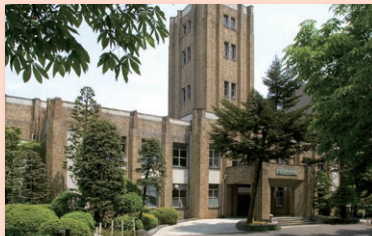
けんこうかいどう 県公会堂