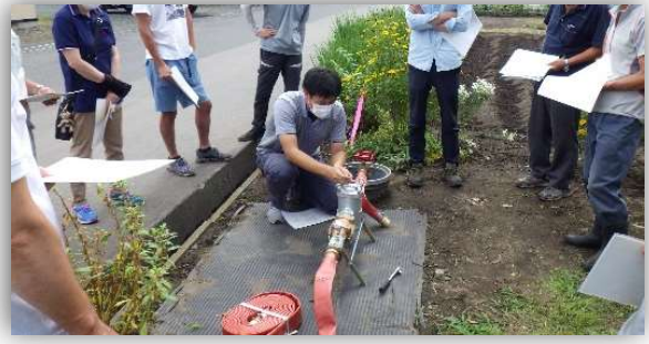
写真1 穴牛・村松ファームポンド