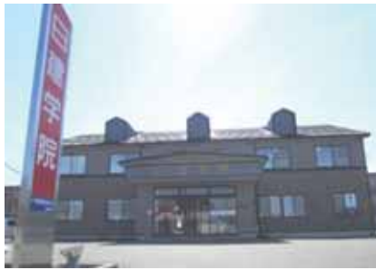
無料駐車場50台完備 コンビニ徒歩3分、イオン車で5分