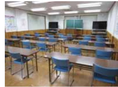
無垢材を使用した健康校舎