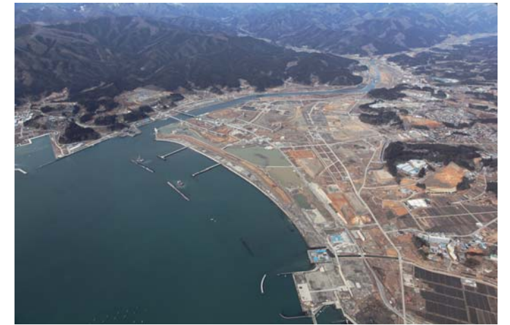
上空から見た公園予定地（平成 27 年 3 月 岩手県撮影）