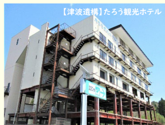
【津波遺構】たろう観光ホテル