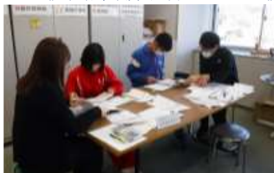
《合同社会体験 社会体験 Week》