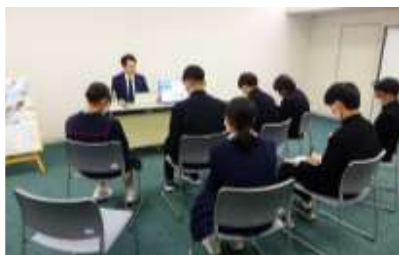
《合同職業講演会 キャリアオーケストラ》