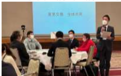
《キャリア教育推進連携シンポジウム》