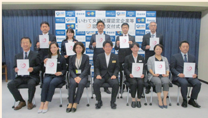
さまざまな企業が認定されています(認定書交付式の様子)