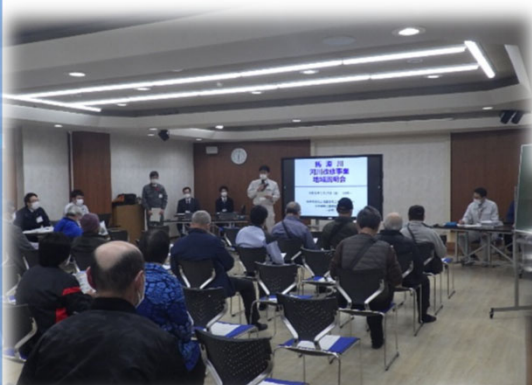
向町・本町地区説明会 (R5.3.16開催の様子)

また、5月からは現地測量に着手しました。関係する地権者の方には、事前に立入通知を行わせていただきました。今後も引き続き、ご協力をよろしくお願いいたします。