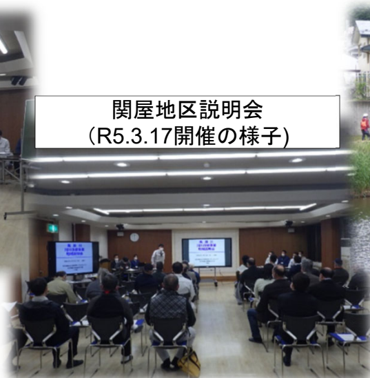
関屋地区説明会 (R5.3.17開催の様子)