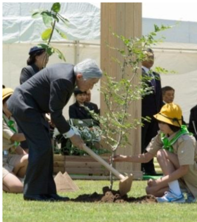
天皇陛下 お手植え (平成26年第65回全国植樹祭)

参加者の植樹樹種は、各会場の特性に沿って選定し、県内外の参加者は、1人複数本を植栽していただきます。なお、詳細については、「基本計画」の中で検討します。