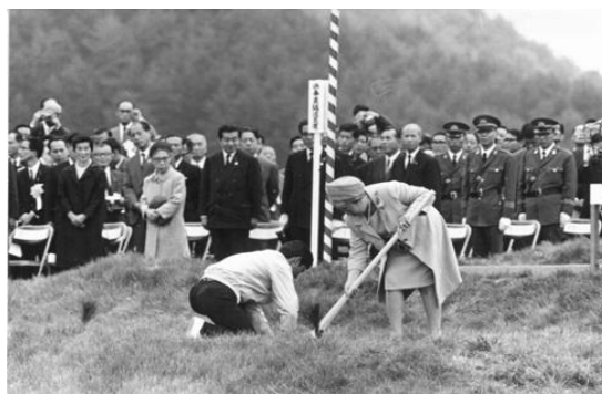
皇后陛下によるお手植え