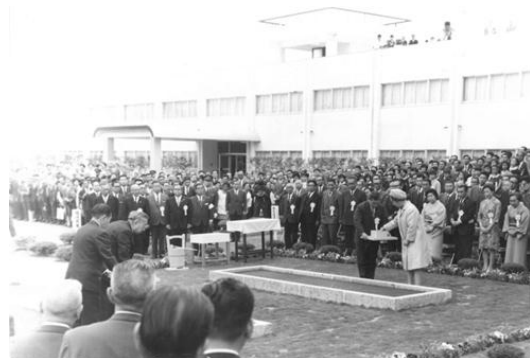
天皇皇后両陛下のお手播き 郡山市 福島県林業試験場にて (昭和45年第21回全国植樹祭)