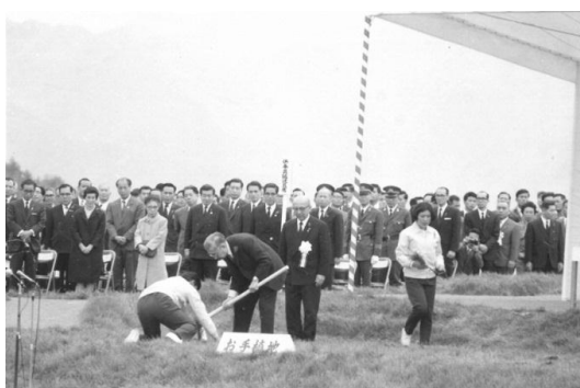
天皇陛下によるお手植え