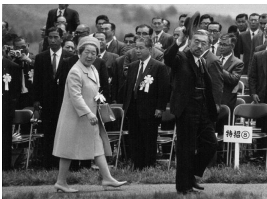
大会会場に御到着された天皇皇后両陛下