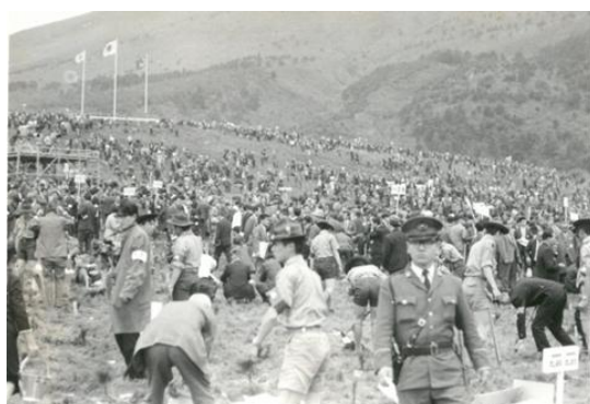
一般参加植樹状況