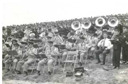
陸上自衛隊音楽隊による演奏