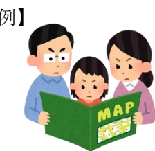
防災マップで避難場所 や避難経路を確認