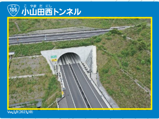
▲2 小山田西トンネル