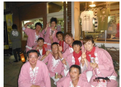
毎年花巻まつりに参加