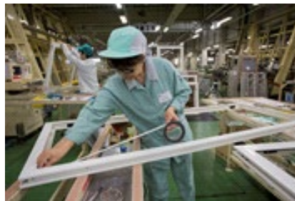
サッシ部品取り付け等女性も活躍できる職場です