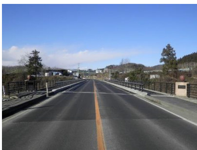
橋梁補修のエキスパート