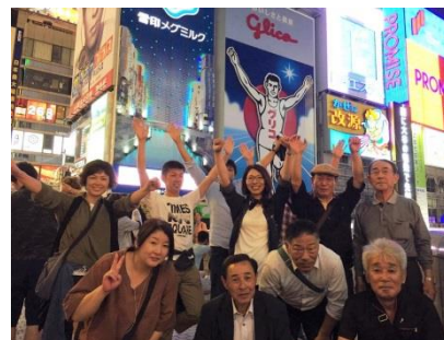
社員旅行（大阪・三重・名古屋）