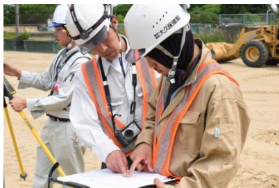
ベテラン社員の熱心な指導