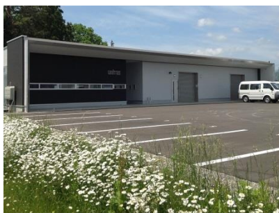
信頼の厚い建築・土木・上下水道工事までトータル施工を行います