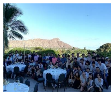
〔社員旅行（コロナ前）〕