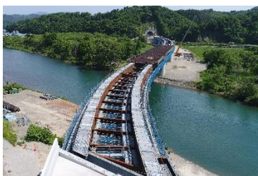
閉伊川横断橋 (北日本機械特定JV)