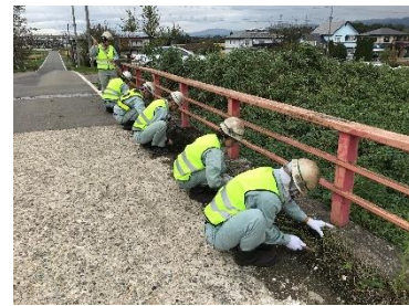
創立記念日ボランティア (橋梁点検・清掃の様子)