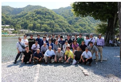
社員旅行 (奈良、京都、神戸、大阪)

花巻まつりの神輿パレードや創立記念日における橋梁清掃ボランティアなど、各種ボランティア活動に参加し、地域との繋がりを大切にしています。また、社内勉強会の開催や、各種資格取得の支援を積極的に進めています。