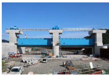
甲子川水門 (丸島アクアシステム特定JV)

人の生活に欠かせない 橋梁や、災害時に人命や町を守る水門、陸閘など重要な社会インフラ整備や、各種建築工事、住宅工事等を行っています。各部署の内容は「業務内容」をご覧ください。