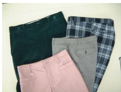
高い品質のスラックス

大手メーカー等から受注し、スラックス（ズボン）を製造している会社です。生地等の素材を完成品まで仕上げ、納品します。