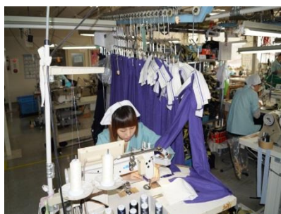
人の手によるていねいな作業