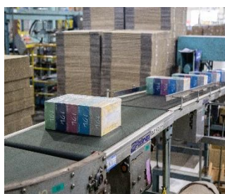
ティッシュ製造工程

創業以来 岩手県内 の森を中心に、 東北の木材 を使用した 国産パルプ を作っており、この国産パルプ 100%を原料とし、高級インクジェット用原紙を生産しています。プリント用に加工された製品は世界各地で使用されています。