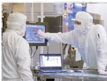
他部署間の協力体制もバッチリ