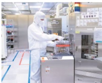
クリーンルーム作業