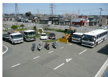
【取扱い教習車勢ぞろい】 バイクから大型二種迄全車種

普通免許は勿論、仕事の免許や趣味の二輪免許迄、免許取得のお手伝いを行っております。