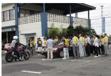
【企業研修のひとつコマ】 このような講習も大切な仕事と考えます