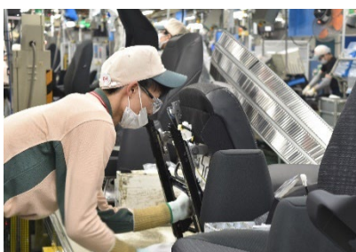
自動車シートの組付け