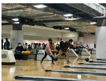
ハイスコアを競います！

毎年新入社員を迎え行う「ボウリング大会」や、模擬店やイベントを楽しめる「秋祭り」を開催しており、社員同士が交流する機会が多い職場です。他にも野球部や卓球部といった部活動、赤い羽根募金や宮城県大衡村にある森林の整備といったボランティア活動も積極的に行っています。