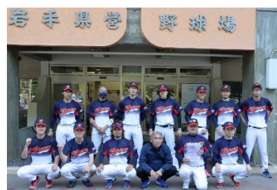
野球部試合後の一枚