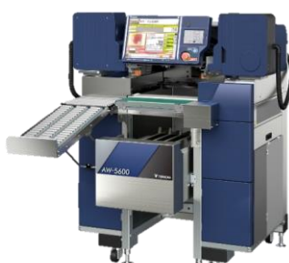
自動計量包装値付機