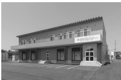
本社・水沢第二工場