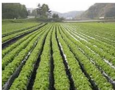
契約栽培のレタス畑