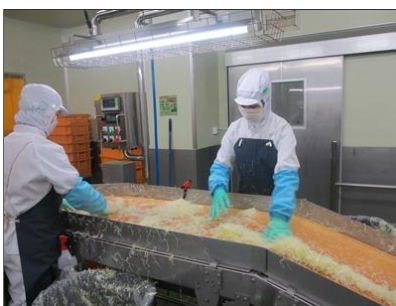
カット野菜の生産ライン

また、夏の納涼会、冬の新年会など社員親睦行事も盛んです。長年にわたり勤続した社員に対して、その功労を称えて国内外への旅行を行っています。