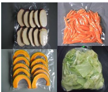
カット野菜の製品例

野菜や果物を食べやすく加工し学校や病院などに提供しています。独自の洗浄技術と氷温設備で 品質と鮮度 を保つ仕組みを作りあげました。また、加工くずを堆肥化することで、循環型原料調達・製品システムの構築を目指しています。