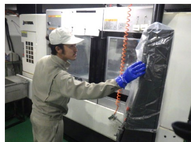
金属部品 加工工程