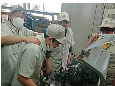
旋盤作業の指導中！

品質、環境、安全、地域貢献等の取組により、お客様と地域の信頼を得られるように努力しているところはもちろん、社員が快適に働き続けられる、 職場づくり を常に心掛けているアットホームな職場です。