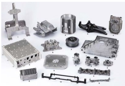
最高の品質を誇る アルミニウム製品加工品の一部

アルミやマグネなどを原料とする金属部品の精密加工を行っております。生産の際に使われる治工具等も 自社 にて開発・設計～製作を行っており、品種のバリエーションに対応した高品質な製品を効率的に量産出来る体制を整えております。