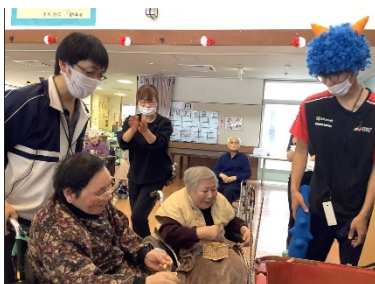
利用者の皆様との一コマ