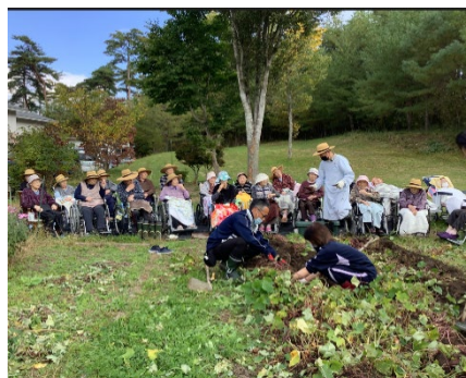
施設の庭での日向ぼっこ

休日数は年間125日前後と他の介護業と比べて多いため、職員はプライベートを楽しみながら、笑顔・元気に仕事に努めることができます。また入社後、業務に慣れるまでの間は、先輩職員と業務を共に行うため、不安なく働けます。