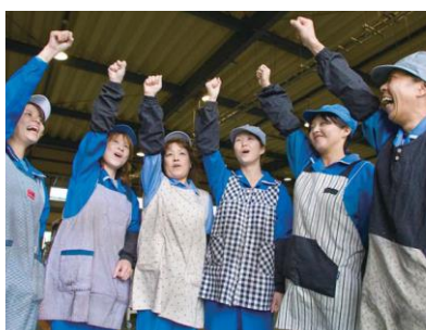
女性がとても元気です

全従業員の約3分の1が女性で、意見を広く集め、子育てしやすい環境を作っています。