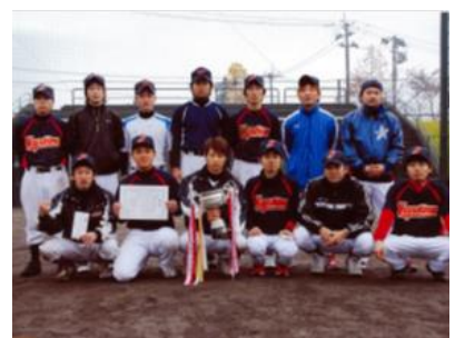
野球チームは強豪で知られます