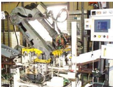
一貫生産にロボットが活躍