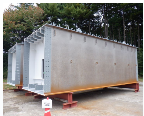
【橋梁上部工工場製作中】