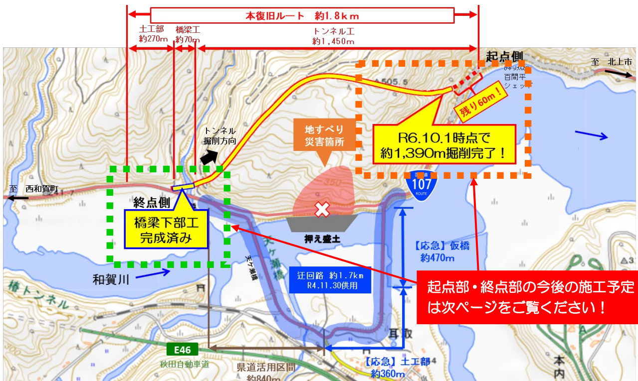
【大石災害復旧事業の概要と進捗状況】