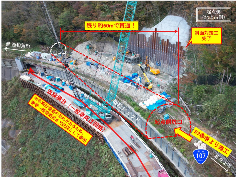
【起点側坑口（北上市側）現在の状況と施工予定】