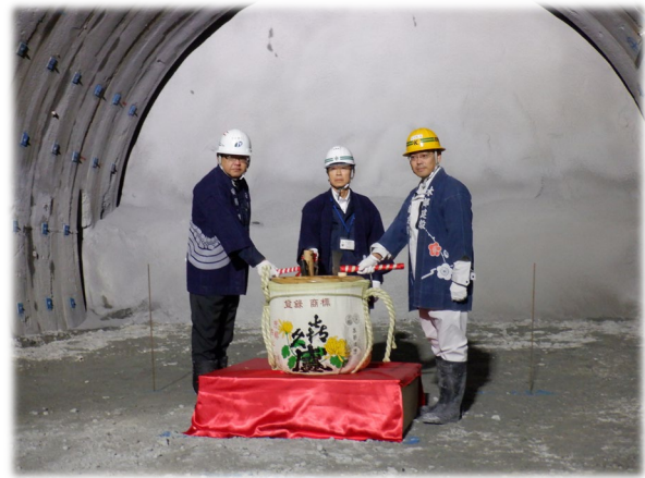
【到達式】受発注者で鏡開き