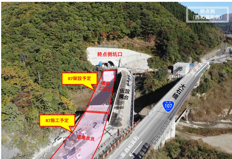
【終点側坑口（西和賀町側）現在の状況と施工予定】