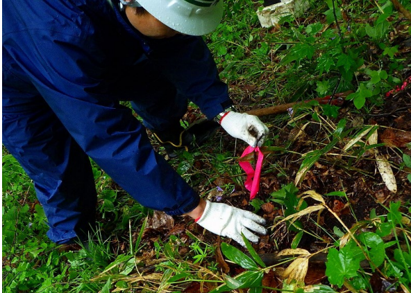
希少種移植状況（令和6年5月13日）

令和6年5月には、現地に自生している希少種の食草等について、工事の影響のない範囲に移植をしながら、仮設備設置のためのヤード造成を行うなど現地へ着手し、本格的なトンネル掘削の準備を始めました。