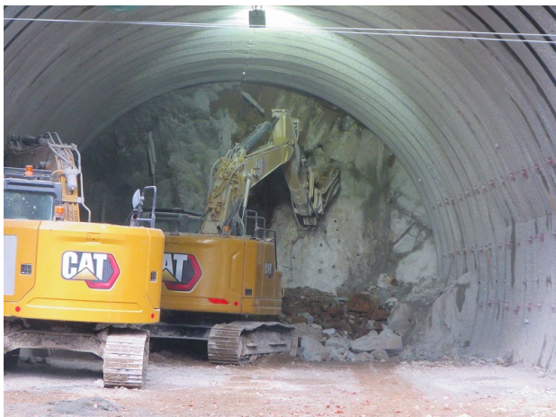
掘削状況：坑口から20m地点 (11月12日)

現在は、想定より硬い凝灰岩が露岩し、坑口へ防音扉を設置するまで重機による掘削を予定していましたが、ブレーカーの歯が立たないため、部分的に発破工法も活用しながら、掘削を進めています。