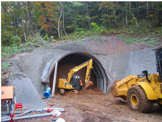
坑口部の掘削状況 (10月24日)