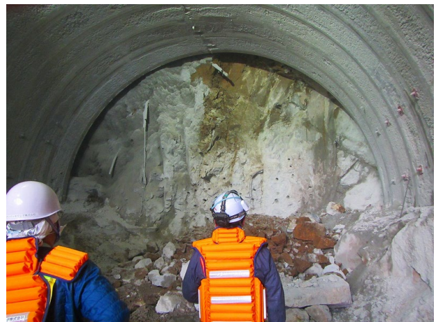
切羽状況：坑口から21m地点 (11月12日)