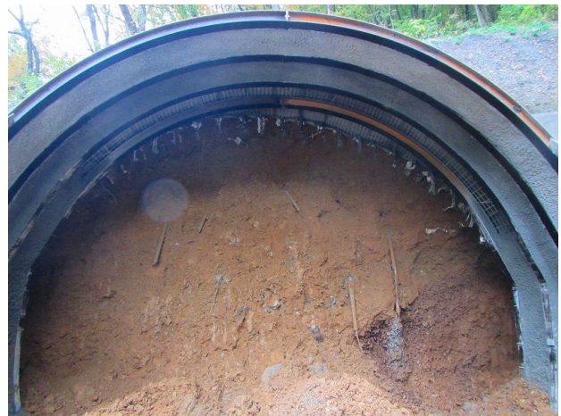
切羽状況 ~崖錐堆積層~ (10月24日)

現在は、想定より硬い凝灰岩が露岩し、坑口へ防音扉を設置するまで重機による掘削を予定していましたが、ブレーカーの歯が立たないため、部分的に発破工法も活用しながら、掘削を進めています。