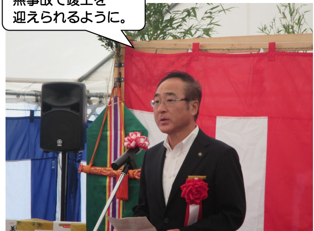
祝辞：八幡平市 佐々木市長