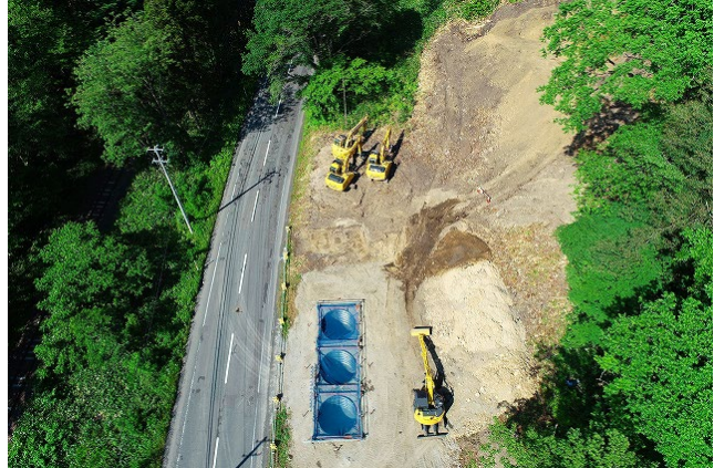
ヤード造成状況（令和6年6月14日）

令和6年9月6日には、工事受注者であるピーエス・コンストラクション株式会社・株式会社近江建設特定共同企業体主催の 安全祈願祭を開催 しました。