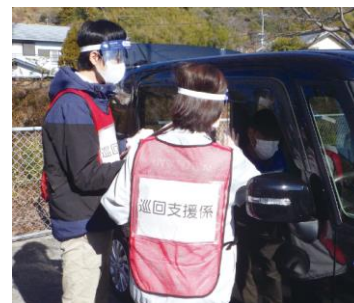
車中泊避難者等の状況把握訓練