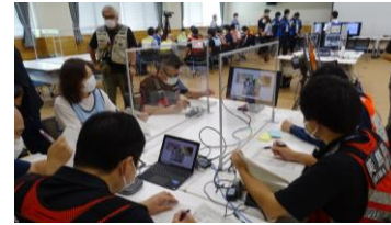
災害ケースマネジメント訓練