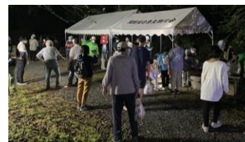
地域住民参加の夜間避難訓練