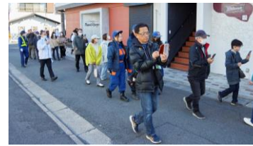
避難支援情報を表示するスマホアプリを活用した避難訓練