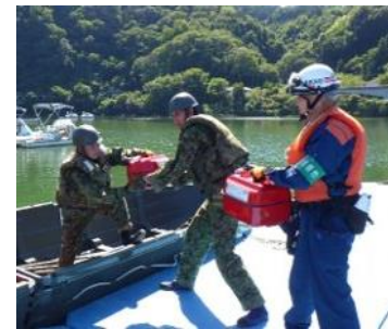
孤立地域を想定した訓練