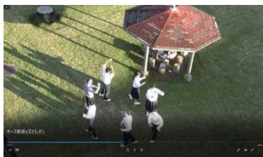
久峰中学校区の紹介動画