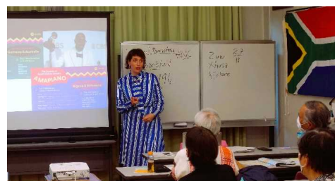
南アフリカ出身JET-ALTによるセミナー