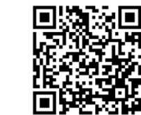
木花中学校区の紹介動画リンク（QRコード）