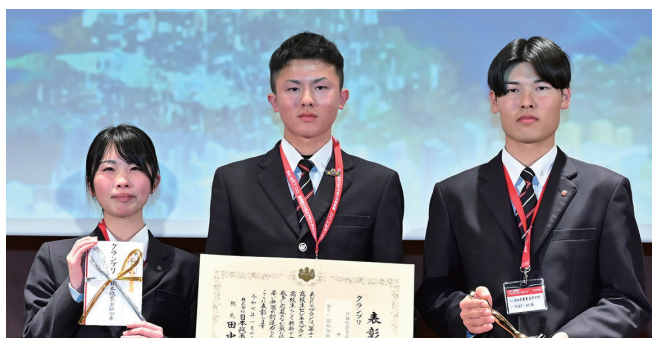
グランプリを受賞した宮城県農業高等学校 [チーム温故知新]