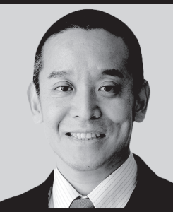
参議院議員 浜田 聡

「NHK党」または右記の比例代表候補者名を書いてください。期日前投票に行つて、投票用紙の写真と共に「#比例はNHK党」というハッシュタグを付けてSNSで拡散してくださった方には、順次いいね&フォローをさせていただきます！