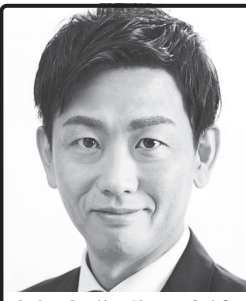
京都市議5期の実績、 地方からの逆襲 東山中・高、専修大学法学部卒、 京都市議5期。