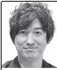
世界で初めて、 子どもの貧困をゼロに NPO法人代表 作家