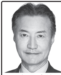
マネーの虎が 日本を変える。 起業家、経営者コンサルタント、 元マネーの虎