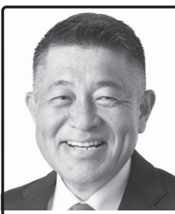
国民の痛みに 応える政治 前沖縄県議会議長