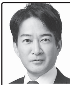
無計画な移民政策を ストップ! 早大、会社員、区議、 都議3期、前党総務会長