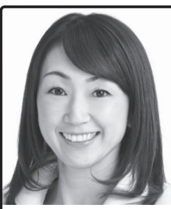
現役母の挑戦! 今の政治を変える! 取手市議会議員 (5期/副議長経験者)