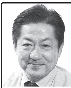
すべての人が安心して 豊かに生きる 参議院議員、厚労委、 維新福島幹事長、理学療法士