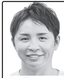
格闘技のチカラで 日本を変える! 総合格闘家・投資家・ You Tuber