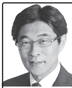
手取りUPで 日本を元気に! 富山県、富山県議、 衆議院議員秘書、参議院議員