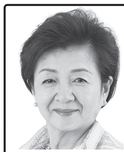
「もったいない!」の その先へ! 元滋賀県知事・ 元びわこ成蹊スポーツ大学学長