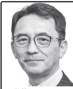
栄養のチカラで 日本の明日を守る 管理栄養士 京都光華女子大学客員教授